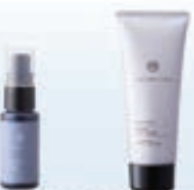
焕亮莹润精华露 焕亮莹润净透洁面露