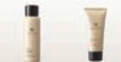
自然堂润肤精华水 自然堂润肤霜