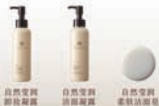
自然堂润肤卸妆露 自然堂润肤卸妆露 自然堂润肤洁面露