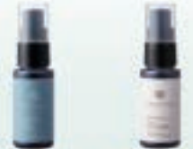
控油平衡精华露 控油平衡舒缓精华露