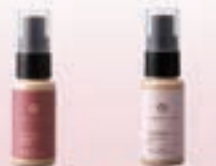
舒缓润肤精华液 舒缓润肤凝胶