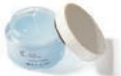
50g ¥3,630 (税后)

许多人可能会为痤疮、粉刺和毛孔黑头而困扰。与青春期的肌肤问题不同，成年肌肤反复出现的红斑和粉刺，导致其产生的一个原因是干燥引起的肌肤节奏紊乱。