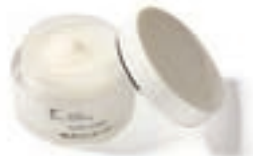
50g ¥4,070 (税后)

这个年龄段的女性会真正地感受到女性的三大肌肤烦恼：斑点、皱纹和皮肤下垂。由于肌肤内部的胶原蛋白和透明质酸等逐渐减少，支撑皮肤弹性的能力减弱，肌肤表面也会出现由紫外线照射和外部刺激引起的斑点、皱纹和暗沉。这个年龄段的女性需要根据自身肌肤状态选择适当的抗衰老护肤品，来保持皮肤的活力和光彩。