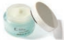
50g ¥3,850 (税后)

由于水分的减少，这个年龄段的女性会有新的肌肤问题如肌肤产生紧绷感，毛孔的放大与黑化等。此外，由于新陈代谢和激素的变化开始显现，在这个年龄段的女性会开始感受到与以往不同的肌肤变化。这个年龄段的女性还会感受到生活环境的变化和其他压力导致的肌肤不适感，恢复力也会开始下降。针对这些令人担忧的干燥和肤质的不均匀所引起的毛孔问题，这个年龄段的女性应该注重补充水分。