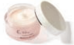
50g ¥4,400 (税后)

由于身体的激素平衡开始变化，这个年龄段的女性会逐渐感到肌肤的变化。随着新陈代谢的减慢，细胞更新的失调导致皮肤粗糙，与之而来所导致的毛孔增大也让人烦恼。另外，由于皮肤弹性减少，皱纹和皮肤下垂等开始变得明显，斑点也变得更深更大。这个年龄段的女性需要全方位地护肤，着重进行肌肤的保湿和抗衰老。