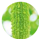
苦瓜提取物 〈张力、美肌成分〉