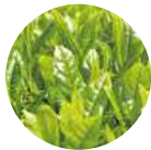
茶叶提取物 〈皮肤紧致、健康肌肤成分〉