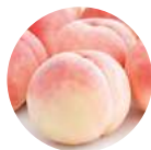
桃果提取物 〈预防皮肤粗糙成分〉