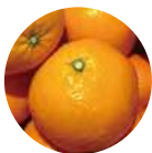
伊予柑果提取物 〈皮肤紧致、肌肤调理成分〉