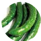
黄瓜果提取物 〈保湿成分〉