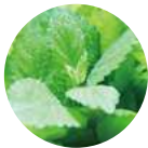
圆叶薄荷叶提取物 〈保湿、肌肤调理成分〉