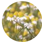
母菊花/叶提取物 〈张力、光泽成分〉