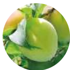
梅籽提取物 〈张力、弹力成分〉